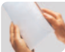
Se abre el sobre sin correr el riesgo de dañar su contenido.

La abridora de cartas IM-15 de Neopost puede funcionar a velocidades de hasta 300 cartas por minuto, de modo que el correo abierto se entrega más pronto. Es fácil de utilizar y muy fiable; puede manipular correo mixto sin que requiera una clasificación previa para ello, también abre una amplia gama de tamaños de sobre. Gracias a su eficiencia, su personal dispondrá de más tiempo para concentrarse en tareas más productivas.